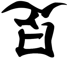
白髪一雄 SHIRAGA KAZUO