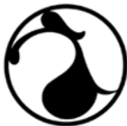
近松のまち・あまがさき

尼崎ゆかりの劇作家・近松門左衛門が生きた時代とその作品を象徴する「マゲ」と尼崎市のローマ字の頭文字「a」をデザイン化したものです。