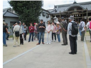
近松健康ウォーク

この他にも寄席、ゴルフ大会、演劇、将棋大会、読書会などいろいろな事業があります☆彡